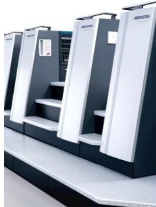
Speedmaster CS 75