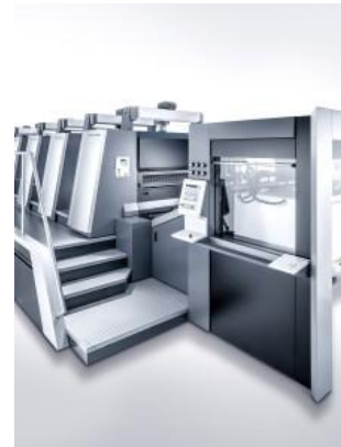
Speedmaster CS 92