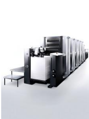
Speedmaster SX 52

八色印刷,适用于 A3 格式,配备了最新的技术,印刷速度高达每小时 15,000 张,为印刷厂提供了一种与网络印刷和数字印刷竞争的替代方式,测试量与装机量超过 4 万台;(2) Speedmaster CS 75 (50 x 70) 采取创新型技术,配备双直径气缸,性能和适用范围比 SX52 更为广泛,从轻量纸张和硬纸板材料均可适用,能源效率和资源利用率均大幅提升;(3) Speedmaster CS 92 (70 x 100) 应用海德堡最新科技,提供了高生产率的,可处理广泛的基材,印刷速度高达每小时 15,000 张,是专门针对商业印刷的产品,性价比较高。